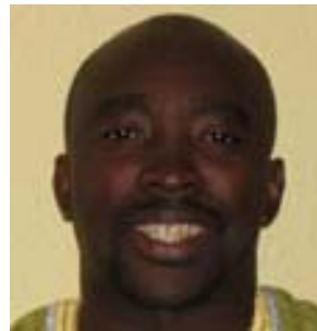
Tutu Alicante EG JUSTICE

EG Justice erzieht, stärkt und engagiert eine neue Generation von Demokratie- und Menschenrechtsanwälten in Äquatorial-Guinea und im Ausland durch Internships, Seminare und Workshops. EG Justice organisiert breitangelegte Kampagnen, führt Rechtsfälle durch, um Vergehen gegen die Menschenrechte vor regionalen, nationalen und internationalen Gerichten zu verfolgen und arbeitet eng mit lokalen Netzwerken zusammen, um diese durch Litigationsprozesse zu ermächtigen.