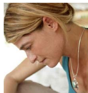
Sasha B. Kramer OURSOIL.ORG