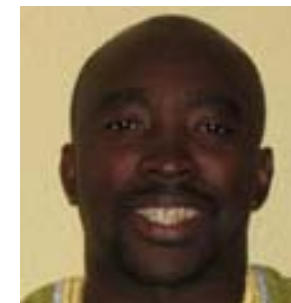
Tutu Alicante EG JUSTICE