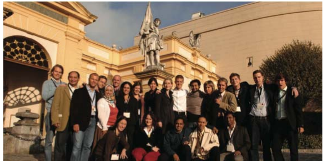
Waldzell/AoF; Melk, 2009